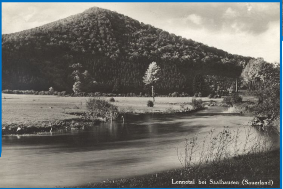
Lennetal bei Saalhausen (Sauerland)