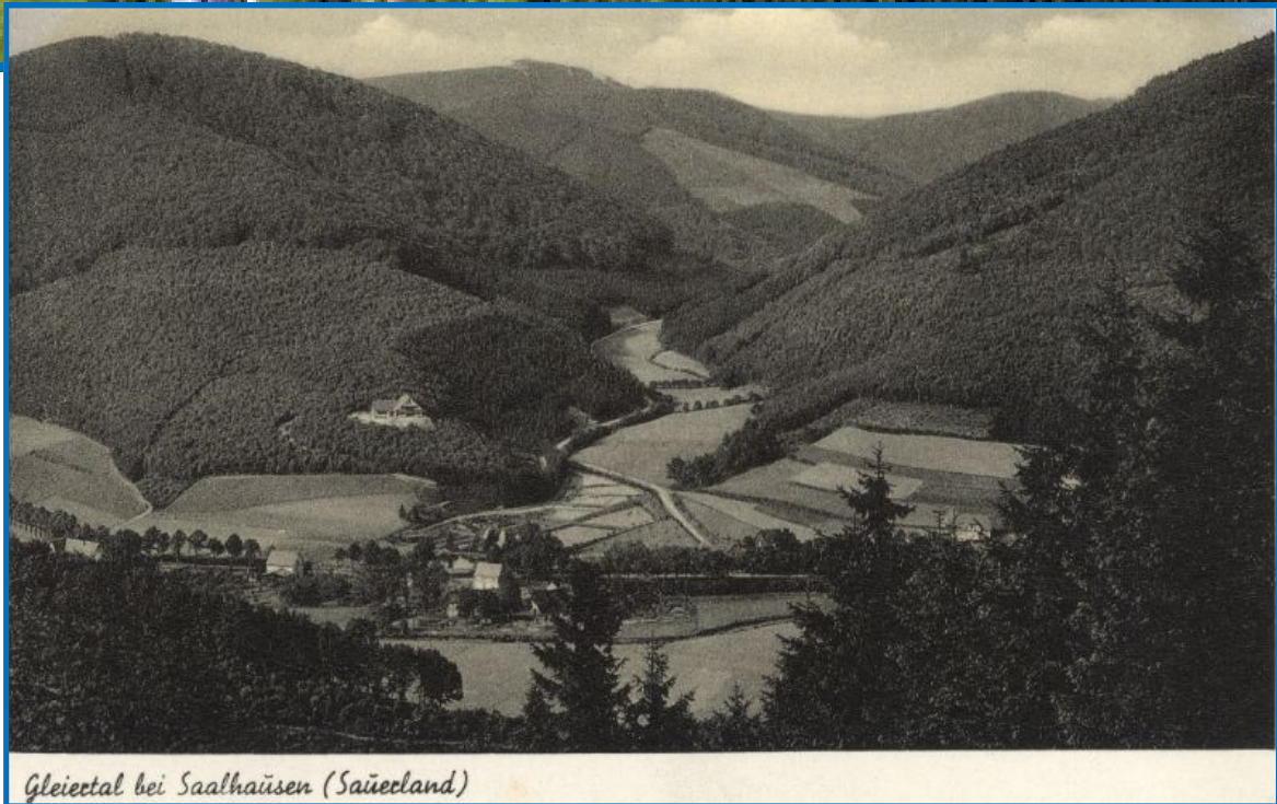
Gleietal bei Saalhäusen (Saueeland)