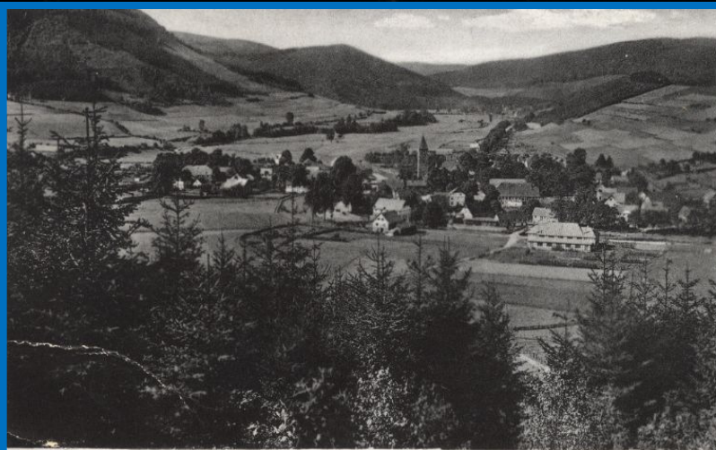
Sommerfeische Saalhausen (Säuecland)