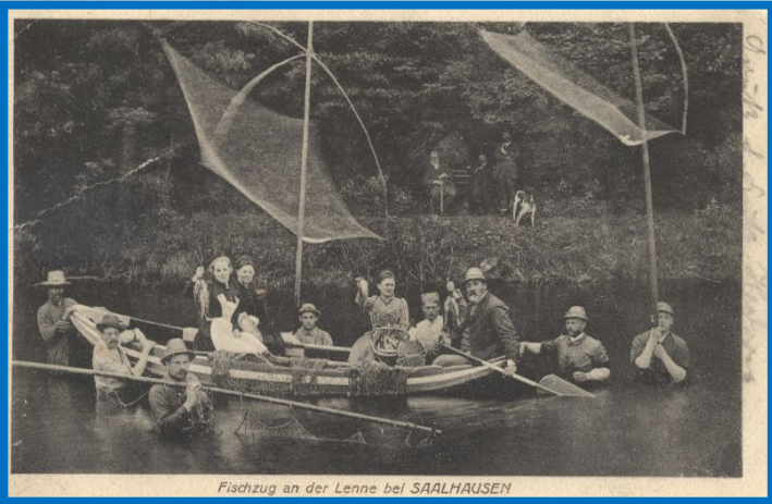
Fischzug an der Lenne bei SAALHAUSEN