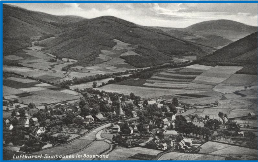
Luftkurort Saalhausen im Sauerland