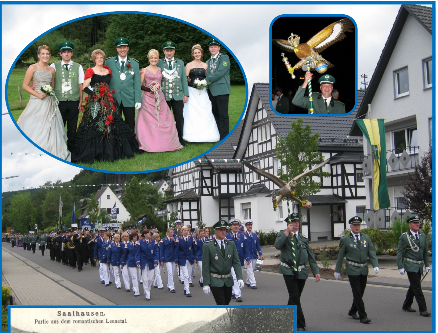
Saalhausen. Partie aus dem romantischen Lennetal.