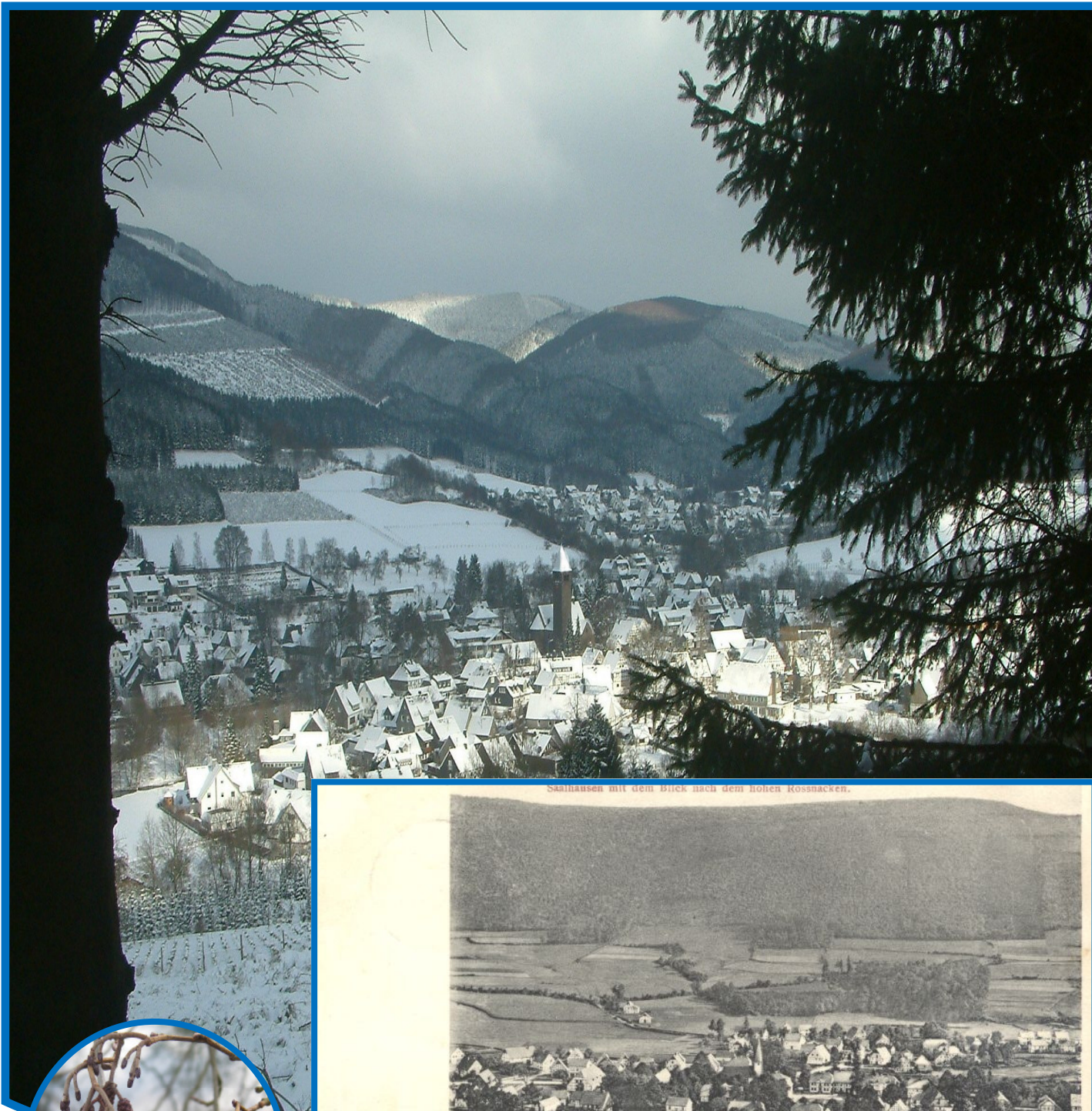
Saalhausen mit dem Blick nach dem hohen Rossmacken.